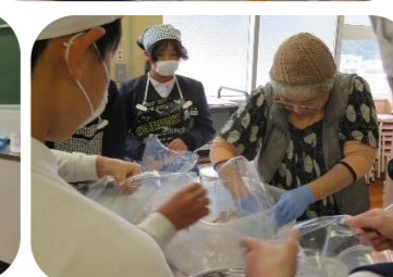
6年 家庭科（味噌作り） 大豆から手作りの味噌をつくりました。